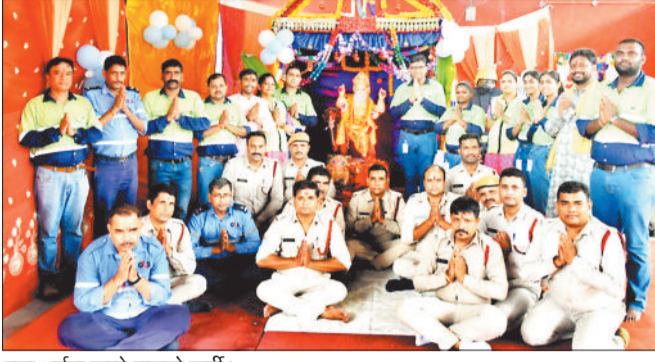
पूजा अर्चना करते बालको कर्मी।