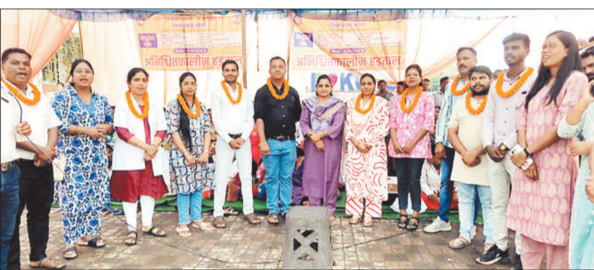
पंडाल में सम्मानित किए गए स्वास्थ्य कर्मों।