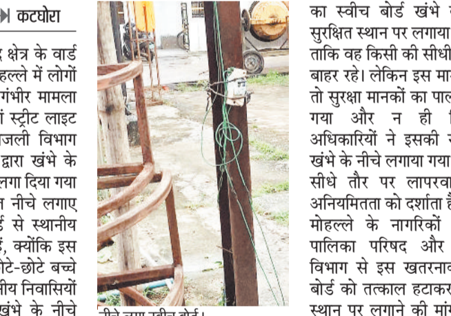
नीचे लगा स्विच बोर्ड।

नगर पालिका परिषद क्षेत्र के वार्ड क्रमांक 4 बाजार मोहल्ले में लोगों की सुरक्षा से जुड़ा गंभीर मामला सामने आया है। यहां स्ट्रीट लाइट जलाने के लिए बिजली विभाग और नगर पालिका द्वारा खंभे के नीचे ही स्वीच बोर्ड लगा दिया गया है। खंभे के बिल्कुल नीचे लगाए गए इस स्वीच बोर्ड से स्थानीय लोग बेहद चिंतित हैं, क्योंकि इस स्थान पर अक्सर छोटे-छोटे बच्चे खेलते रहते हैं। स्थानीय निवासियों का कहना है कि खंभे के नीचे बिजली का स्वीच बोर्ड लगाने से कभी भी बड़ा हादसा हो सकता है। परिजन हर समय इस बात से डरे और सशंकित रहते हैं कि कहीं