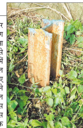
कटा हुआ विद्युत पोल।