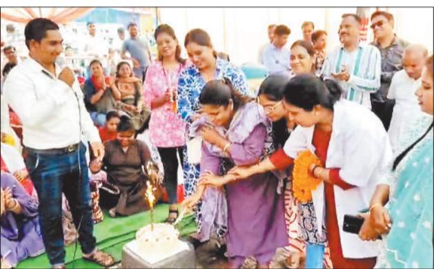
केक काटकर पीएम का जन्मदिन मनाते हड़ताली कर्मों।