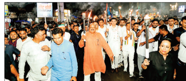
मशाल रैली में शामिल कांग्रेसी।

अखिल भारतीय कांग्रेस कमेटी के तत्वाधान में मंगलवार को सुभाष चौक में वोट अधिकार यात्रा और वोट चोर गद्दी छोड़ हस्ताक्षर अभियान के साथ विशाल मसाल जुलूस निकाला गया इस मौके पर कांग्रेस कमेटी के छत्तीसगढ़ प्रभारी सचिन पायलट ने भाजपा पर प्रहार करते हुए कहा कि केंद्र सरकार ने सरकारी संस्थाओं को अपने कब्जे में ले लिया है। सीबीआइ व ईडी का दुरुपयोग किसी से छुपी नहीं है। चुनाव में हार जीत होती रहती है, लेकिन वोट चोरी बर्दाश्त नहीं होगी। चुनाव आयोग की निष्पक्षता